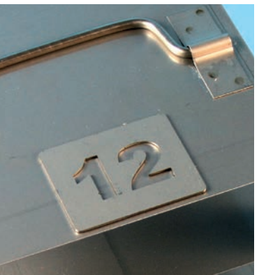
EPPi® Ident Markierungsschilder siehe Seite 15.