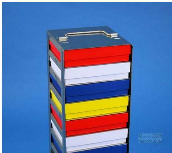
Ansicht mit Boxen