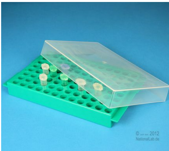
Oberseite für 1,5/2,0 ml Röhren