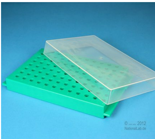
Unterseite für 0,5 ml Röhren