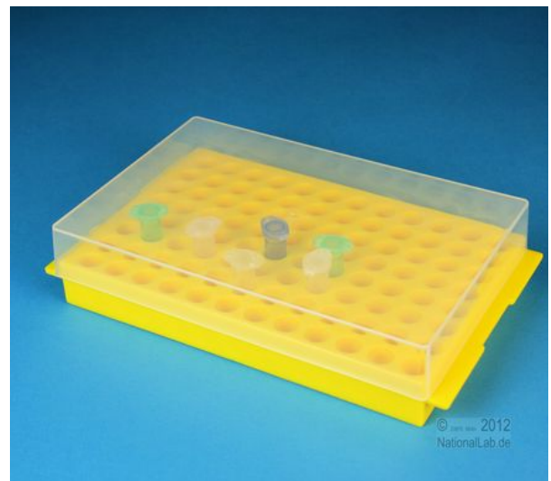
Gesamtansicht (geschlossener Deckel)