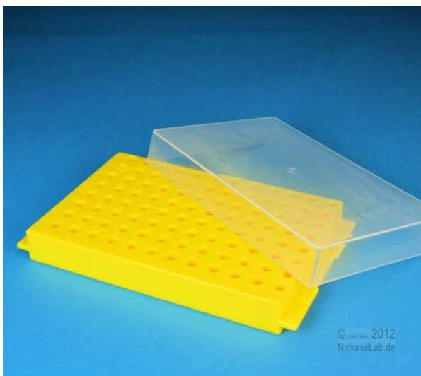
Unterseite für 0,5 ml Rührchen