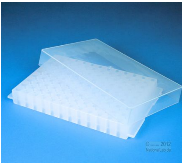
Unterseite für 0,5 ml Röhren