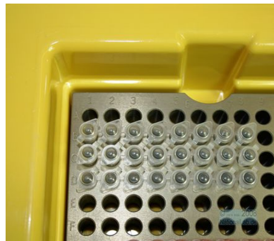
Detailansicht (alpha-numerische Codierung)