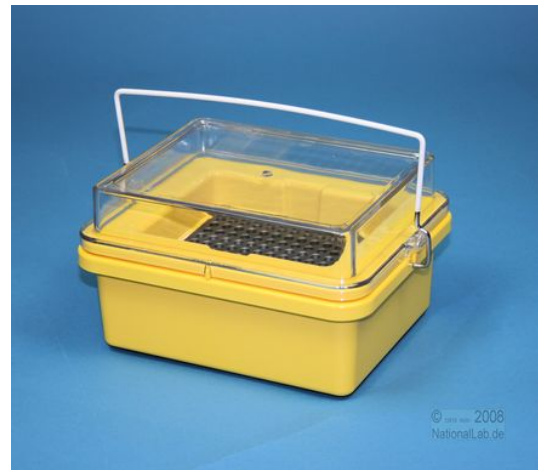
Gesamtansicht mit Tragegriff