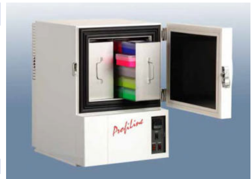
ProfiLine Pegasus PLPE 0486 (optional mit Ordnungssystem, sehen Sie dazu den separaten Katalog)