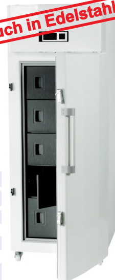
ProfiLine Pegasus PLPE 4186EWN