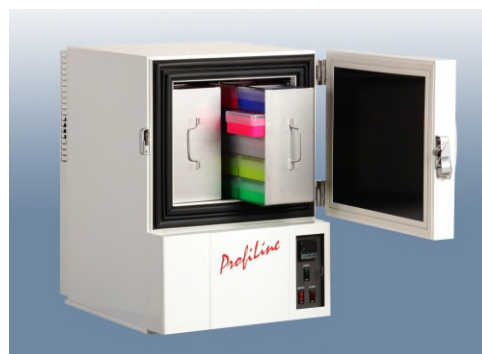
ProfiLine Pegasus PLPE 0486 (optional mit Ordnungssystem, sehen Sie dazu den separaten Katalog)