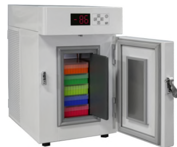
ProfiLine Pegasus PLPE 0186EWN (optional mit Ordnungssystem, sehen Sie dazu den separaten Katalog)