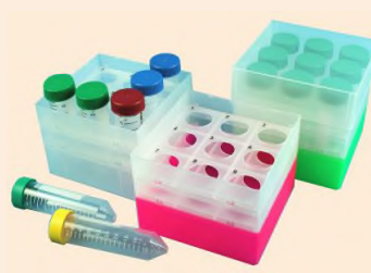
Kunststoffboxen aus Polypropylen