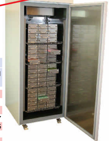
LabStar Sirius LSSI 7505EWN (Das abgebildete Ordnungssystem ist optional. Sehen Sie dazu den separaten Katalog.)