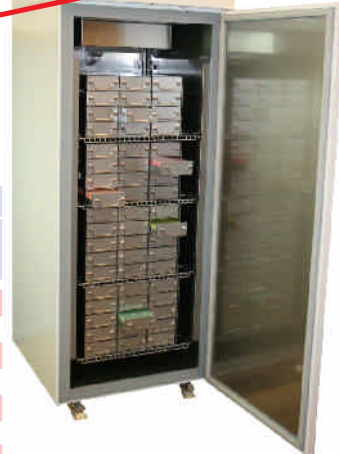
LabStar Sirius LSSI 7505EWN (Das abgebildete Ordnungssystem ist optional. Sehen Sie dazu den separaten Katalog.)