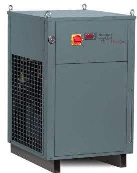
FlowCool Unicus (mit Option Farbe RAL 7043 - verkehrsgrau B)

Weitere Optionen/Zubehör sowie Pumpenalternativen auf Anfrage.