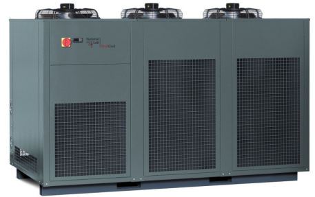
AirCool Ventus (mit Option Farbe RAL 7043 - verkehrsgrau B)