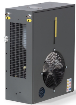
AirCool Ventus (mit Option Farbe RAL 7043 - verkehrsgrau)

Weitere Optionen/Zubehör sowie Pumpenalternativen auf Anfrage.