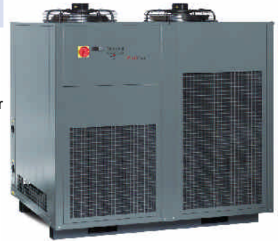
ProfiCool Genius (mit Option Sonderfarbe RAL 7043, verkehrsgrau B)