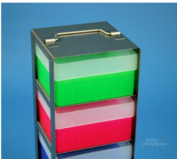
Ansicht mit Boxen