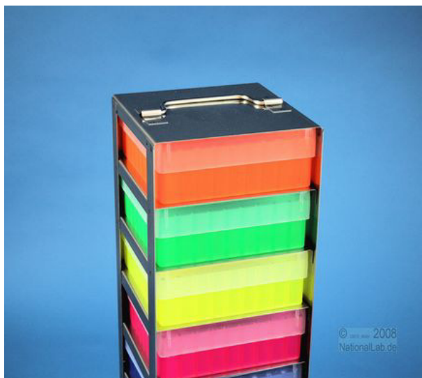
Ansicht mit Boxen