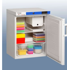
ML0906WN mit Ordnungssystem (optional)