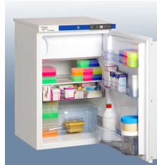
ML1306WN mit Ordnungssystem (optional)