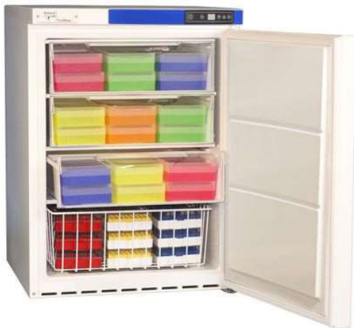
Gesamtansicht (offen) mit optionalem Ordnungssystem

Angebot gilt nur solange Vorrat reicht! Zwischenverkauf vorbehalten!