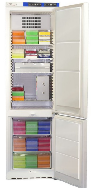
ProfiFrost PFU40xxKWU (Abb. mit Ordnungssystem. Siehe Katalog.)