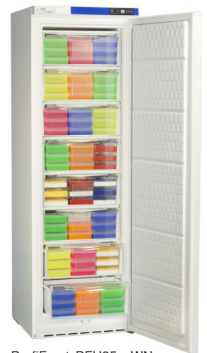
ProfiFrost PFU35xxWN (Abb. mit optionalen Kryoboxen. Siehe Katalog.)