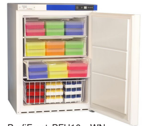
ProfiFrost PFU16xxWN (Abb. mit optionalen Kryoboxen. Siehe Katalog.)