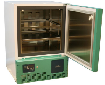
LabStar Sanguis LSSA1105EWU