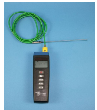
MIN/MAX Thermometer mit zusätzlichem Temperaturfühler